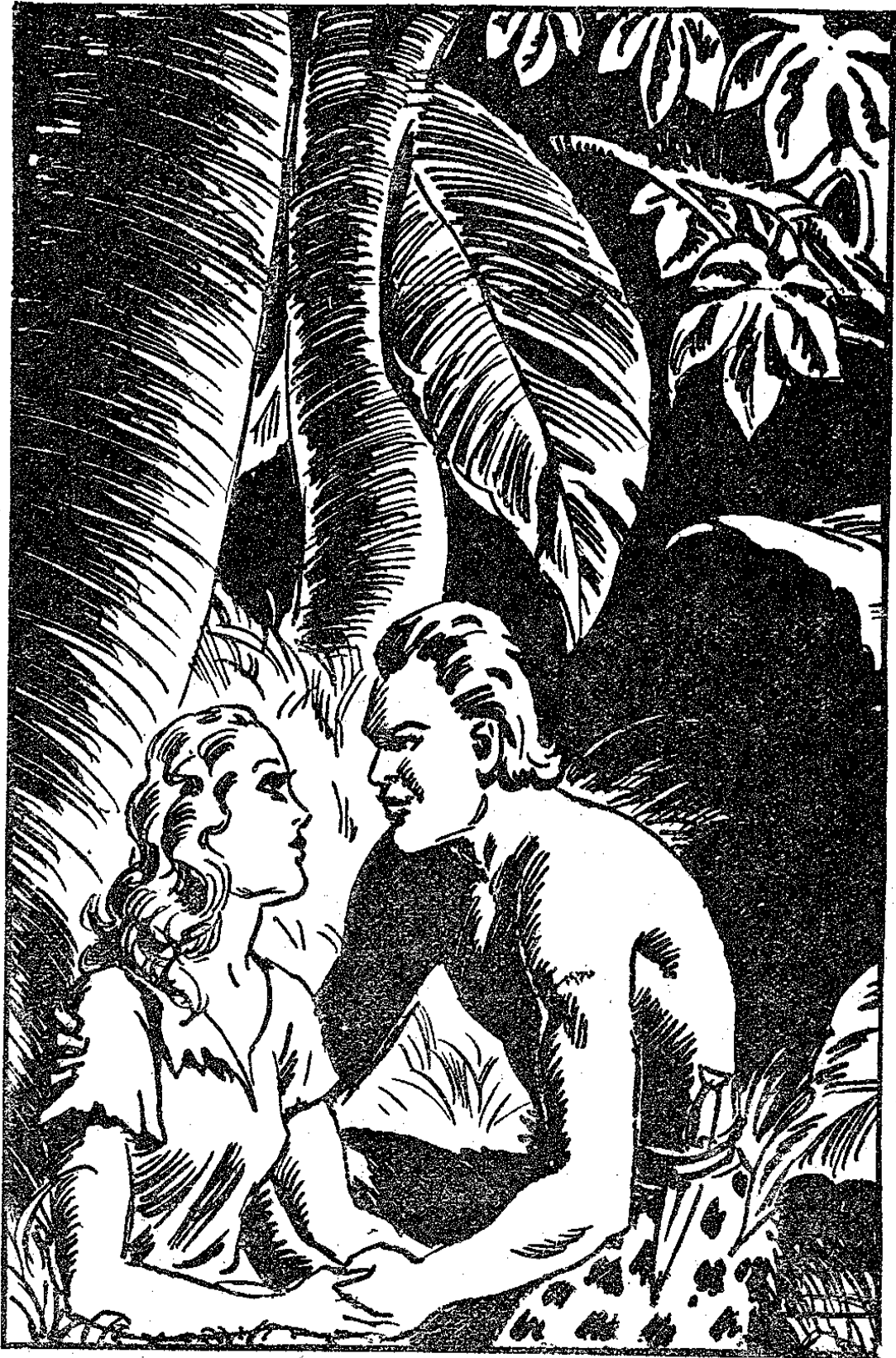
LA JEUNE FILLE CONTEMPLAIT LE VISAGE SOURIANT DE TARZAN