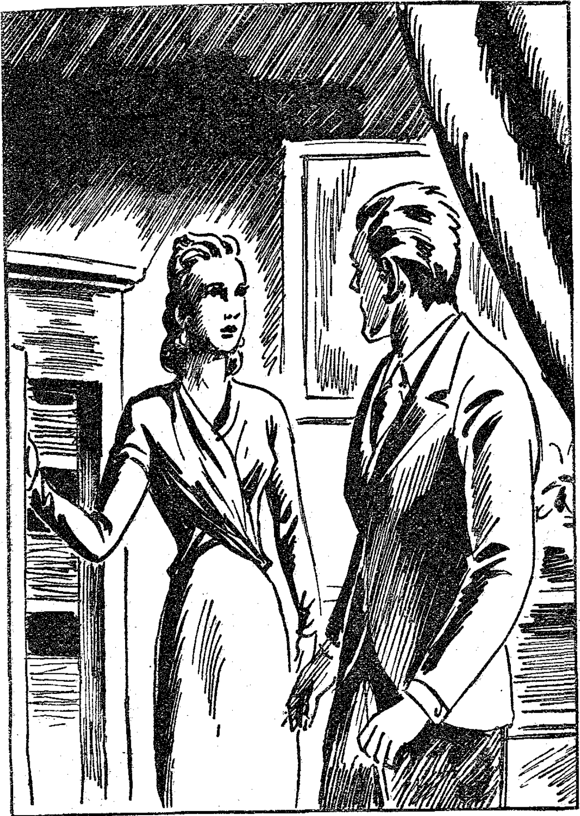
OLGA DÉCLENCHA UN MÉCANISME SECRET