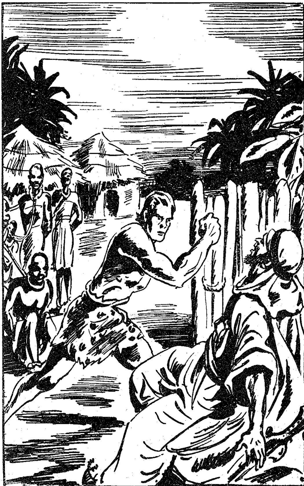
TARZAN RENVERSA L'ARABE D'UN COUP DE POING.