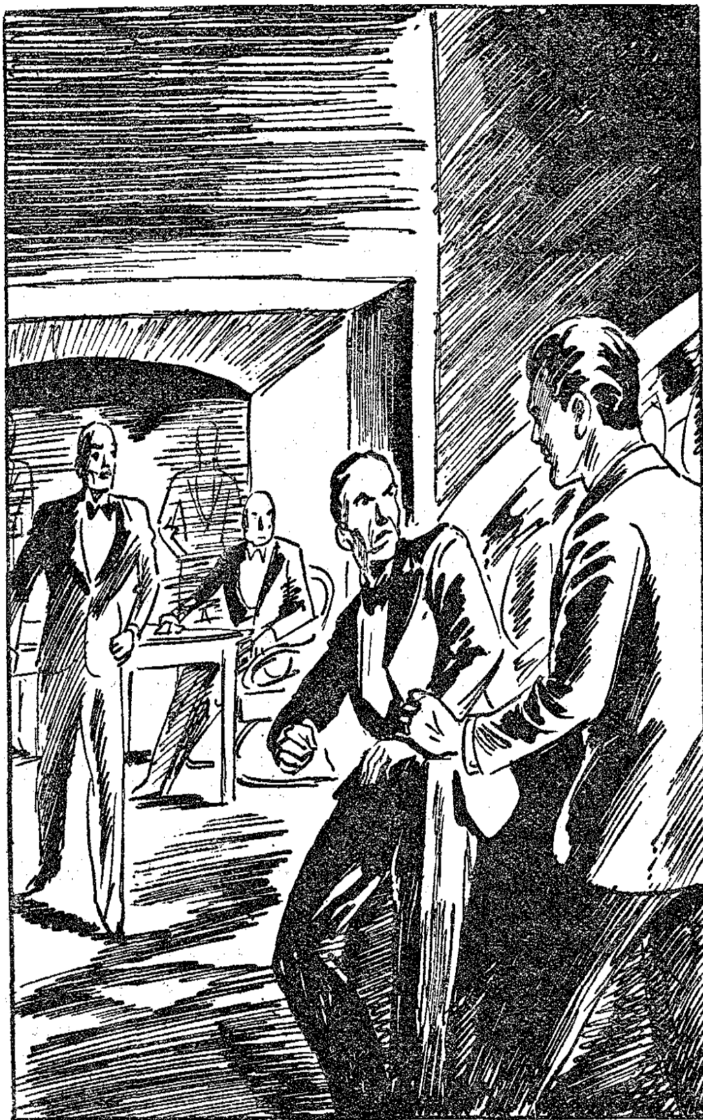
TARZAN TENAIT DANS SA POIGNE UN INDIVIDU D'ASPECT CHÉTIF