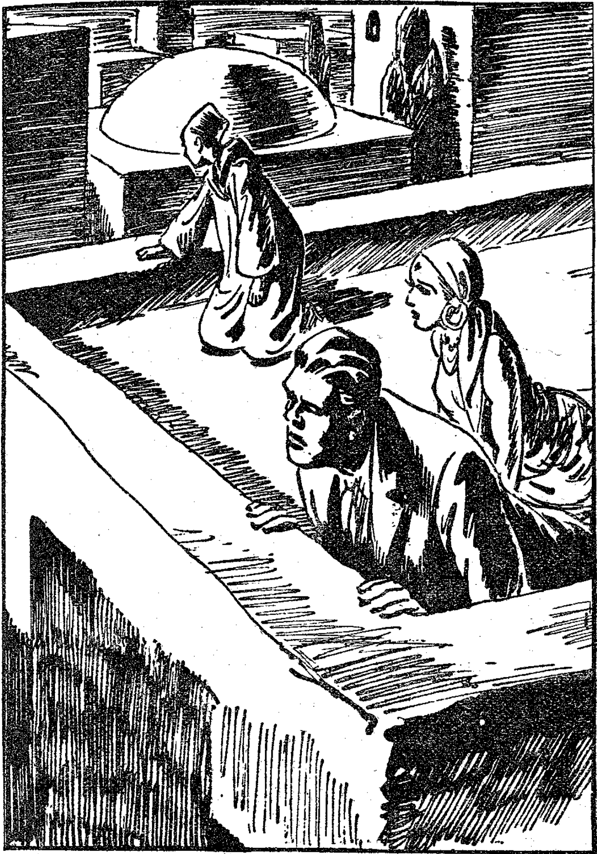
LES FUGITIFS ÉCOUTAIENT LES CRIS DE LEURS POURSUIVANTS